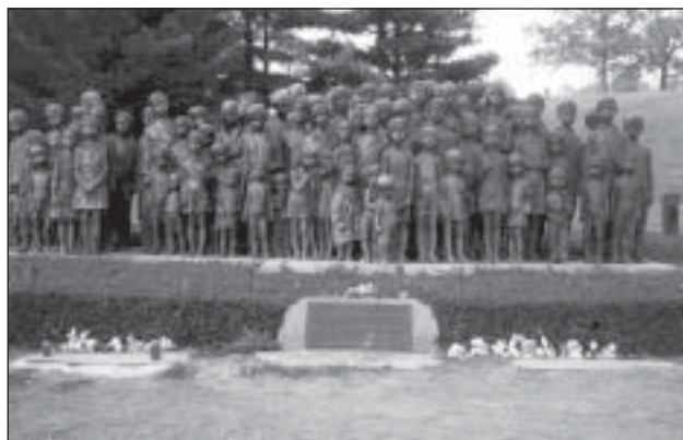
Památník v Lidicích

V pátek 5. 12. 2003 se za zpěvu koled a vánočních písní slavnostně rozsvítil vánoční strom u Základní školy TGM v Bojkovicích.