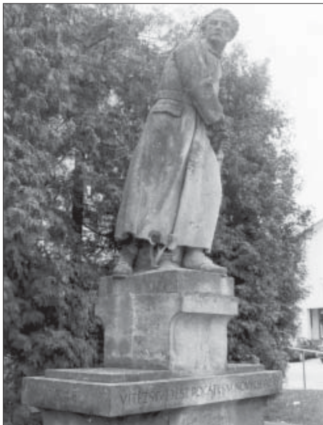
Socha Svobody před Městským úřadem v Bojkovicích