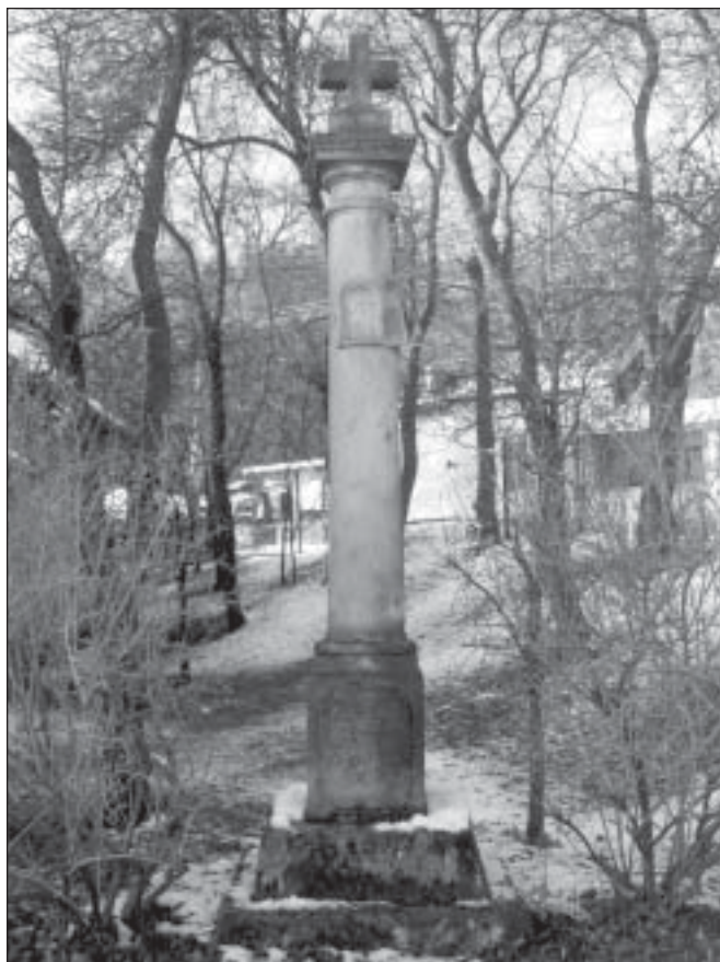
Boží muka v Přechovicích