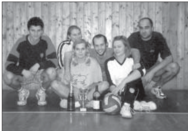
Bojkovice 16. 11. 2003