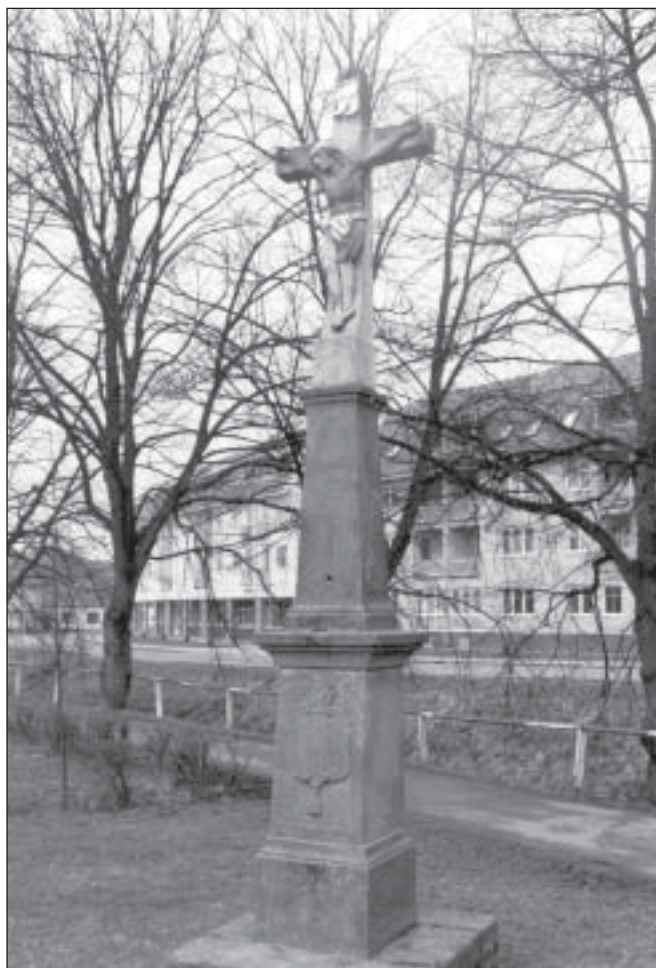
Kříž na Nábřeží Svobody