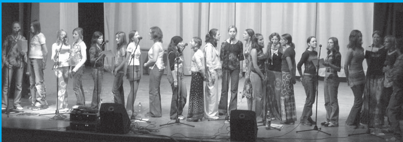
Sbor Sv. Pluka z Uherského Hradiště