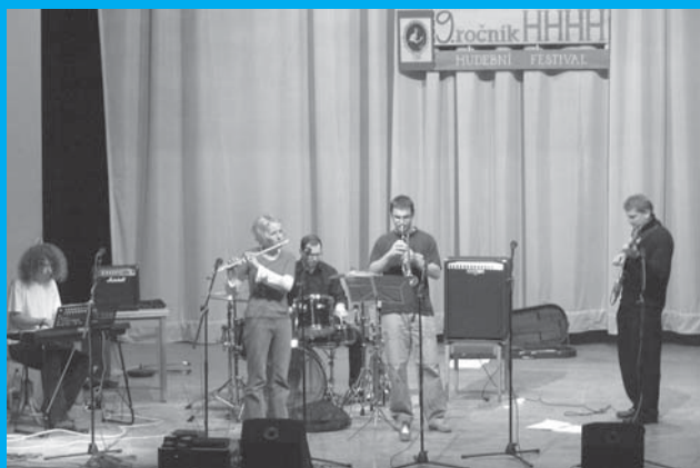
Jazzová kapela Polojasno.