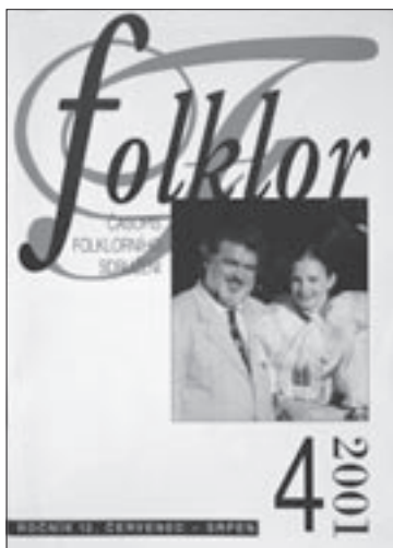
Obálka čísla 4/2001

nebyl ničím výjimečný, kdyby se poprvé a vlastně naposledy nedoháněl skluz ve vydávání. A kdyby se v něm nevizovalo na jaro 1992 vydání prvního Kalendáře folklorních akcí ČR a v úvodním slově nebyla znovu výzva „ k zaslání materiálů, které rádi ostatním zpřístupníme. Pište o svých nápadech, úspěších i problémech. “ A ještě zavedení nové rubriky ARTAMA informuje bylo spojeno s tímto dvojčíslem.