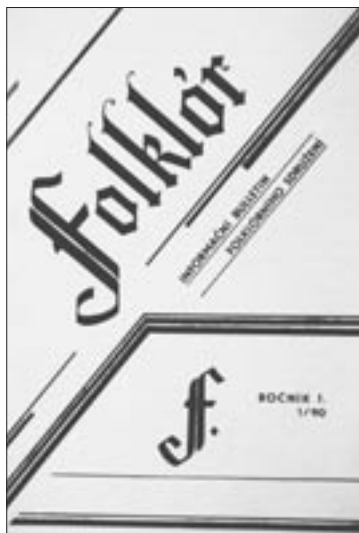
Obálka prvního čísla

V následujícím čísle 1/91 hledání optimálního dělení již šestadvacetistránkového čísla do nějakých okruhů pokračuje a vymezují se čtyři: základní materiály (tj. materiály sdružení), odborně poradenské materiály (rozhovory, rozbor a hodnocení, metodické a vzdě-