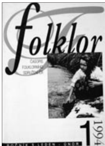
Obálka čísla 1/1994