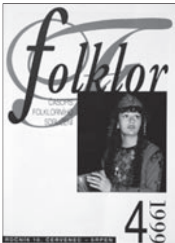
Obálka čísla 4/1999