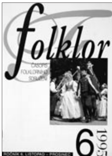
Obálka čísla 6/1995

František Synek (3/91 až 2/92 podepsán jako redakce)