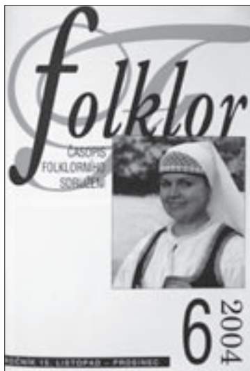
Obálka čísla 6/2004